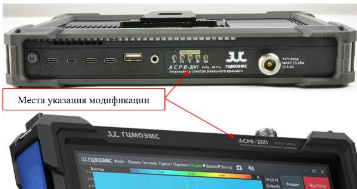
Рисунок 4 – Места указания модификации анализаторов спектра реального времени портативных АСРВ-П