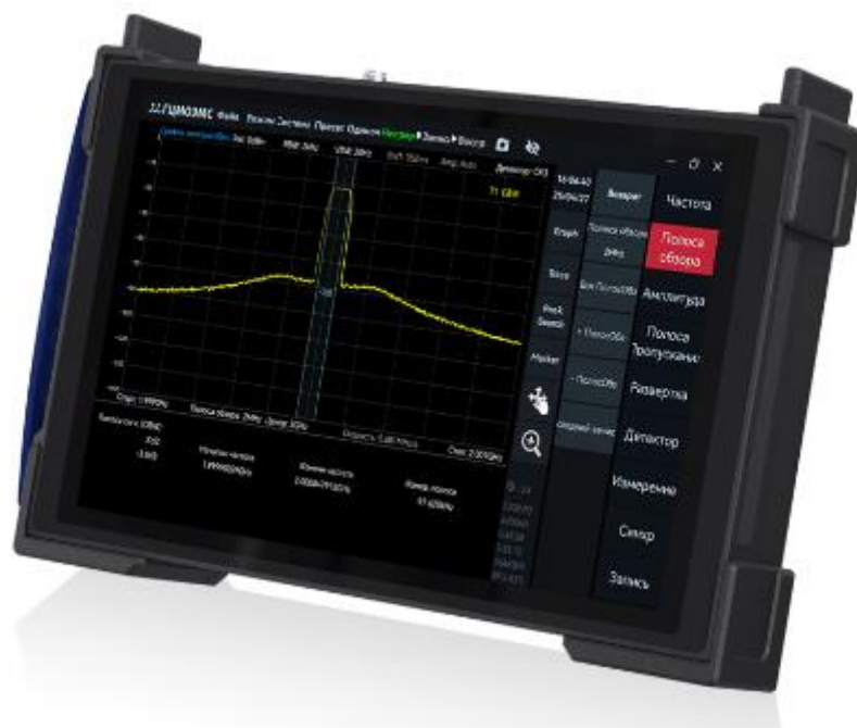
Рисунок 3 – Общий вид анализаторов спектра реального времени портативных АСРВ-9ПВ, АСРВ-20ПВ, АСРВ-40ПВ