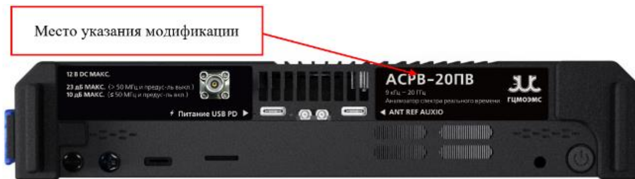
Рисунок 6 – Место указания модификации анализаторов спектра реального времени портативных АСРВ-ПВ