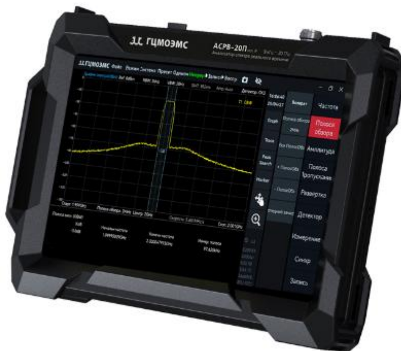
Рисунок 2 – Общий вид анализаторов спектра реального времени портативных АСРВ-9П, АСРВ-20П, АСРВ-40П с опцией IP