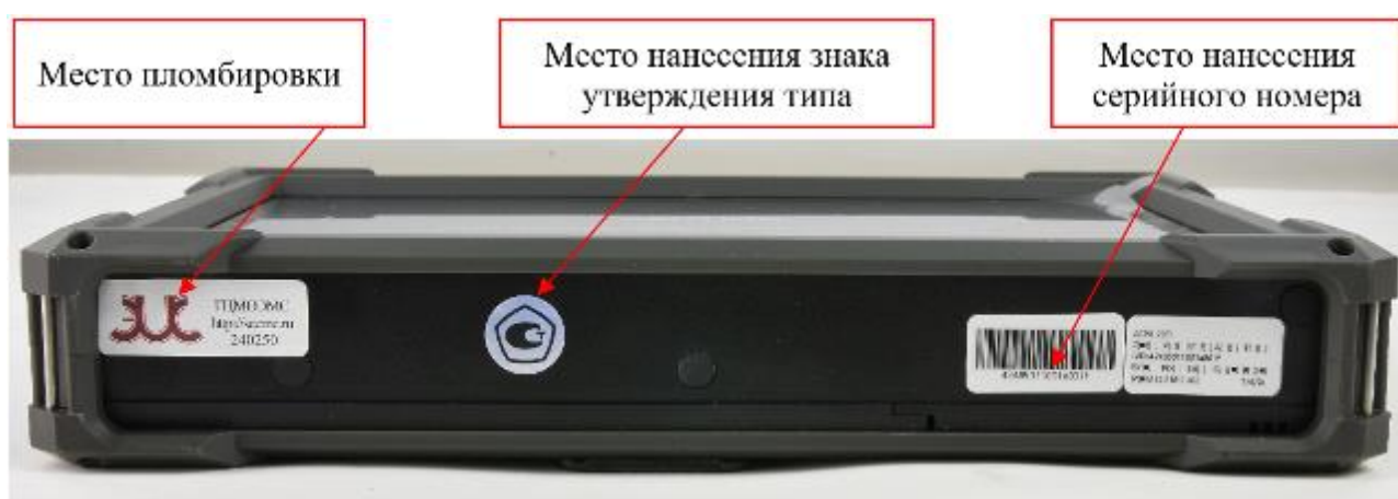
Рисунок 7 – Место нанесения знака утверждения типа, схема пломбировки от несанкционированного доступа и место нанесения серийного номера, идентифицирующего каждый экземпляр средства измерений